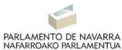
Hau da Nafarroako Parlamentuaren ikurra