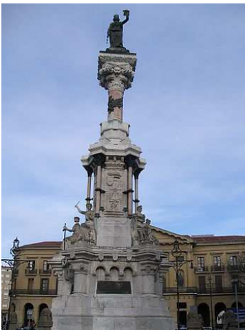
Hau da Foruen monumentua

Nafarroako Parlamentua Iruñean dago Navas de Tolosa kaleko 1 zenbakian. Sarasate pasealekutik oso hurbil dago Foruen monumentuaren parean.