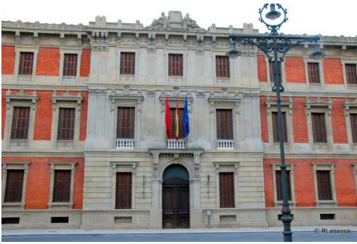
Hau da Nafarroako Parlamentua

Nafarroako Parlamentua Iruñean dago Navas de Tolosa kaleko 1 zenbakian. Sarasate pasealekutik oso hurbil dago Foruen monumentuaren parean.